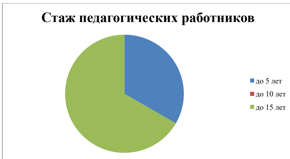
Диаграмма с характеристиками стажа педагогического состава ДОУ

В 2021 году педагоги Детского сада приняли участие: